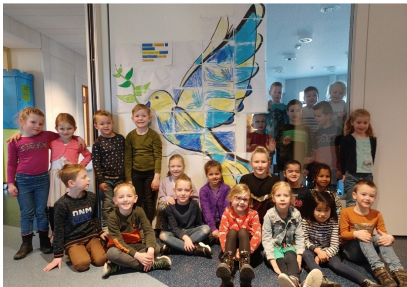
Groep 2 heeft een prachtige Vredesduif gemaakt!

Wij zijn druk bezig om een mooie en zinvolle actie voor te bereiden om ook de kinderen te betrekken bij de hulp die nodig is. Volgende week dinsdag vergadert de OR nog hierover en daarna hoort u van mij welke actie we gaan doen. Dit zal plaatsvinden in de week van 21 maart.