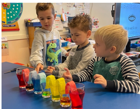
Proefjes met kleuren

Koffie/thee/fris/lekkers staat voor iedereen klaar!